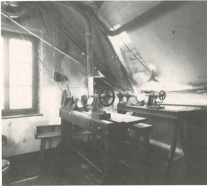
11 Teilansicht der ehemaligen Horndrechselei Höpp, die in einem Hinterhof an der Ellerstraße in Solingen-Ohligs gelegen war. Die Werkstatteinrichtung wurde 1986 vom Rheinischen Industriemuseum übernommen.

originale Werkstätten der handwerklichen Weiterverarbeitung zu errichten und in sozialhistorischen Ausstellungen zu dokumentieren. Neben den Werkstätten, die im Hinblick auf die Weiterverarbeitung der im Museum zu Demonstrationszwecken hergestellten Scherenrohlinge zu sehen sind – also einer Scherenhärterei, einer Scherenschleiferei und einer Scherennagelei – sollen dabei in wechselnden Ausstellungen auch weniger beachtete Handwerkszweige – so etwa die Horndrechselei von Messergriffen – vorgestellt werden. Im Zuge der Rationalisierung der Solinger Schneidwarenindustrie in den vergangenen drei Jahrzehnten wurde die Arbeit der Heimarbeiter mechanisiert und in die Fabriken verlagert. In der Folge gingen nicht nur die handwerklichen Qualifikationen der traditionellen heimgewerblichen Schneidwarenarbeiter, sondern auch ihre charakteristischen handwerklichen Arbeitsstätten verloren. Nur die wenigsten sind heute in ihrem Denkmalwert offiziell erfaßt und ge-