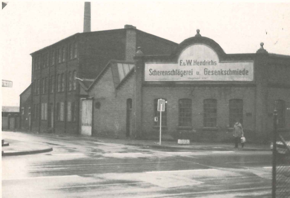
9 Teilansicht der Gesenkschmiede Hendrichs, von der Merscheider Straße in Richtung Bäckershof. Das dreigeschossige Gebäude im Hintergrund wurde bis zum Ersten Weltkrieg als Dampfschleiferei betrieben.

lichen Veränderungen vorgenommen worden. Nicht nur die gesamte technische Ausstattung, sondern auch die Arbeiter der Firma Hendrichs wurden in das Museum übernommen. Die früheren Firmenbeschäftigten demonstrieren an ihren gewohnten Arbeitsplätzen die Herstellung von Scherenrohlingen und wirken bei der Betreuung der Besucher mit. Der Museumsbesucher erlebt die Arbeitswelt einer Gesenkschmiede einschließlich des ohrenbetäubenden Lärms der Fallhäm-